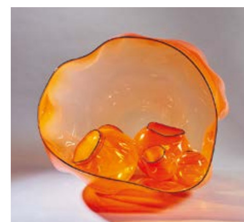
Orange Basket Set with Flint Lip Wraps, Dale Chihuly